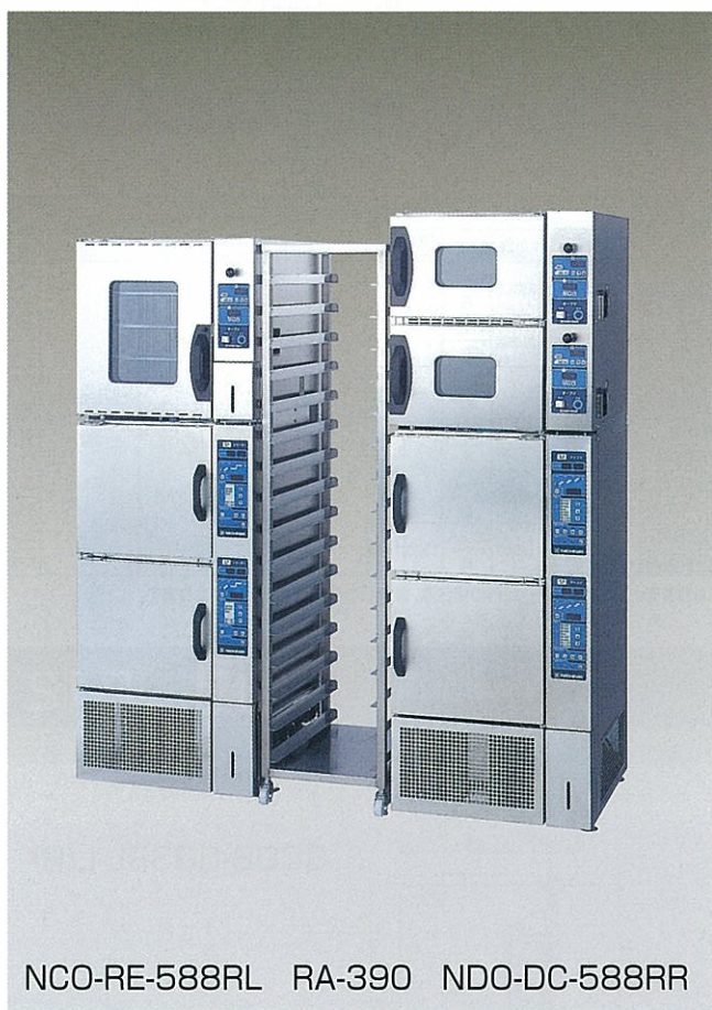
NCO-RE-588RL RA-390 NDO-DC-588RR