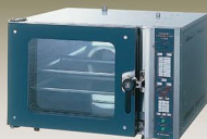
SCON-9.5B(ベーカリーコンベクションオープン)