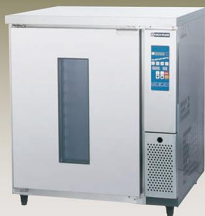
NDC-1126N(ドゥーコンディショナー)